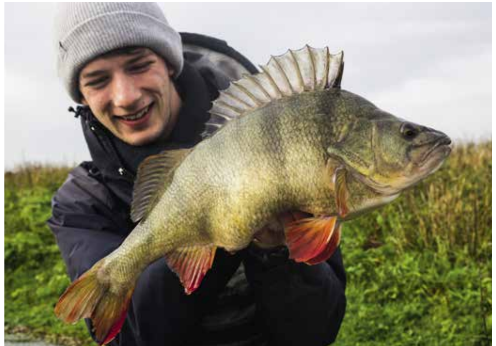
Een prachtige beloning voor het koude wintervissen, een moddervette baars!

Een neopreen pak zou voor velen een eerste keuze zijn. Door de isolerende werking wordt veel kou buiten gehouden. Toch kent een neopreen pak ook twee belangrijke nadelen. Het pak ademt niet, waardoor trans-