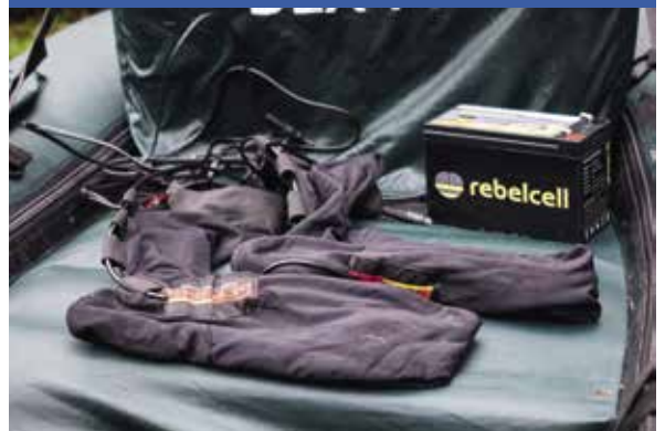
Elektrisch verwarmde sokken, aangesloten op de Rebelcell accu zijn een ware uitkomst!