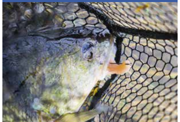
Een drijvend schepnet helpt je om makkelijk vis te landen uit de bellyboat.