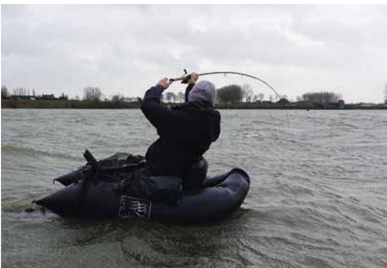
Met de Top 2000 op de achtergrond vis drillen, wat wil je nog meer?