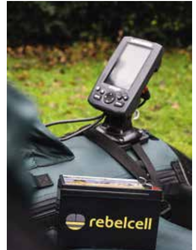
Een fishfinder is een belangrijk accessoire op je bellyboat.

is het wandelen een stuk minder uitdagend. Sommige boten hebben deze banden standaard meegeleverd, in andere gevallen kun je deze er los bij kopen.