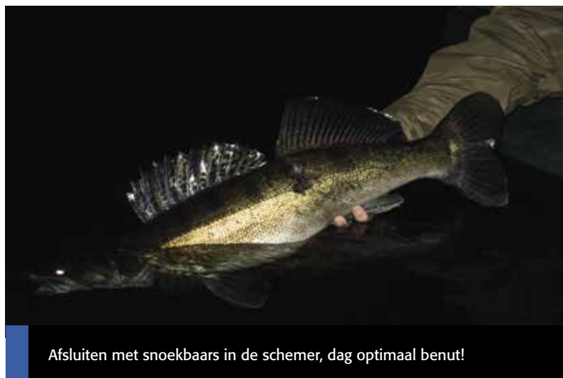
Afsluiten met snoekbaars in de schemer, dag optimaal benut!