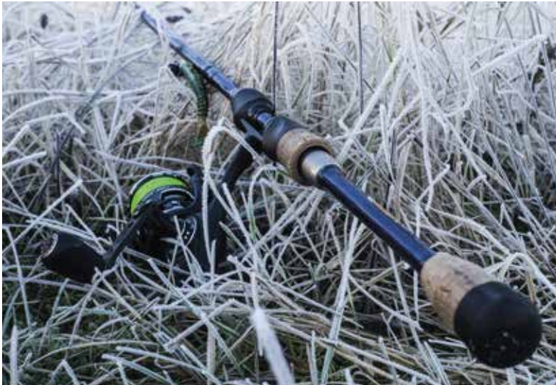
Koude, windstille dagen kunnen prachtig zijn om te vissen.