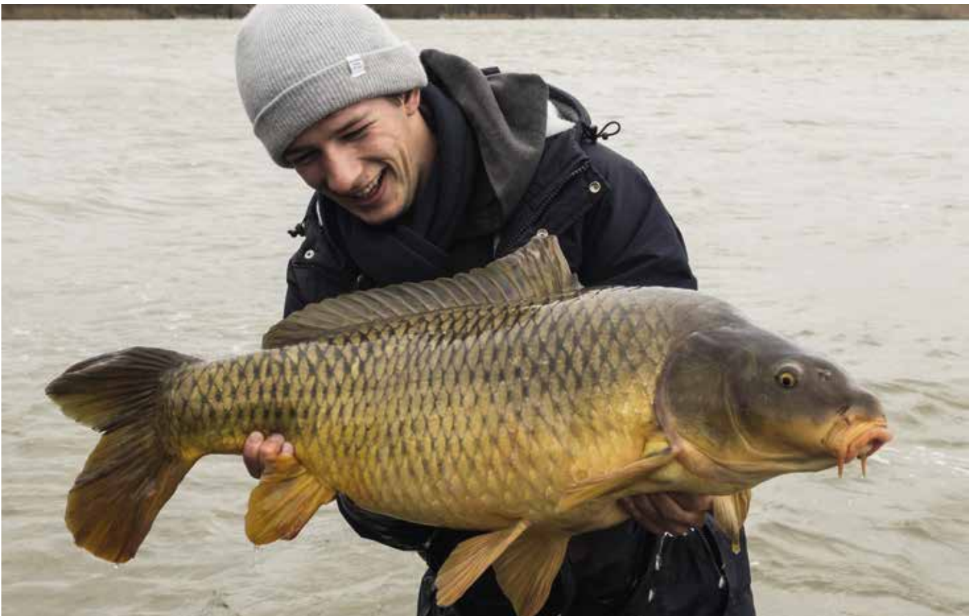
Verrassing uit het koude water! Een grote rivierkarper heeft het shadje gegrepen.

van handschoenen tijdens het vissen niet echt fijn. Ik verlies toch wat gevoeligheid in de hengel en ik vind het altijd een gedoe om ze goed droog te houden. Daarom vis ik zelf zonder handschoenen. Er is één truc die voor mij altijd helpt tegen koude handen. Deze truc heb ik onlangs van