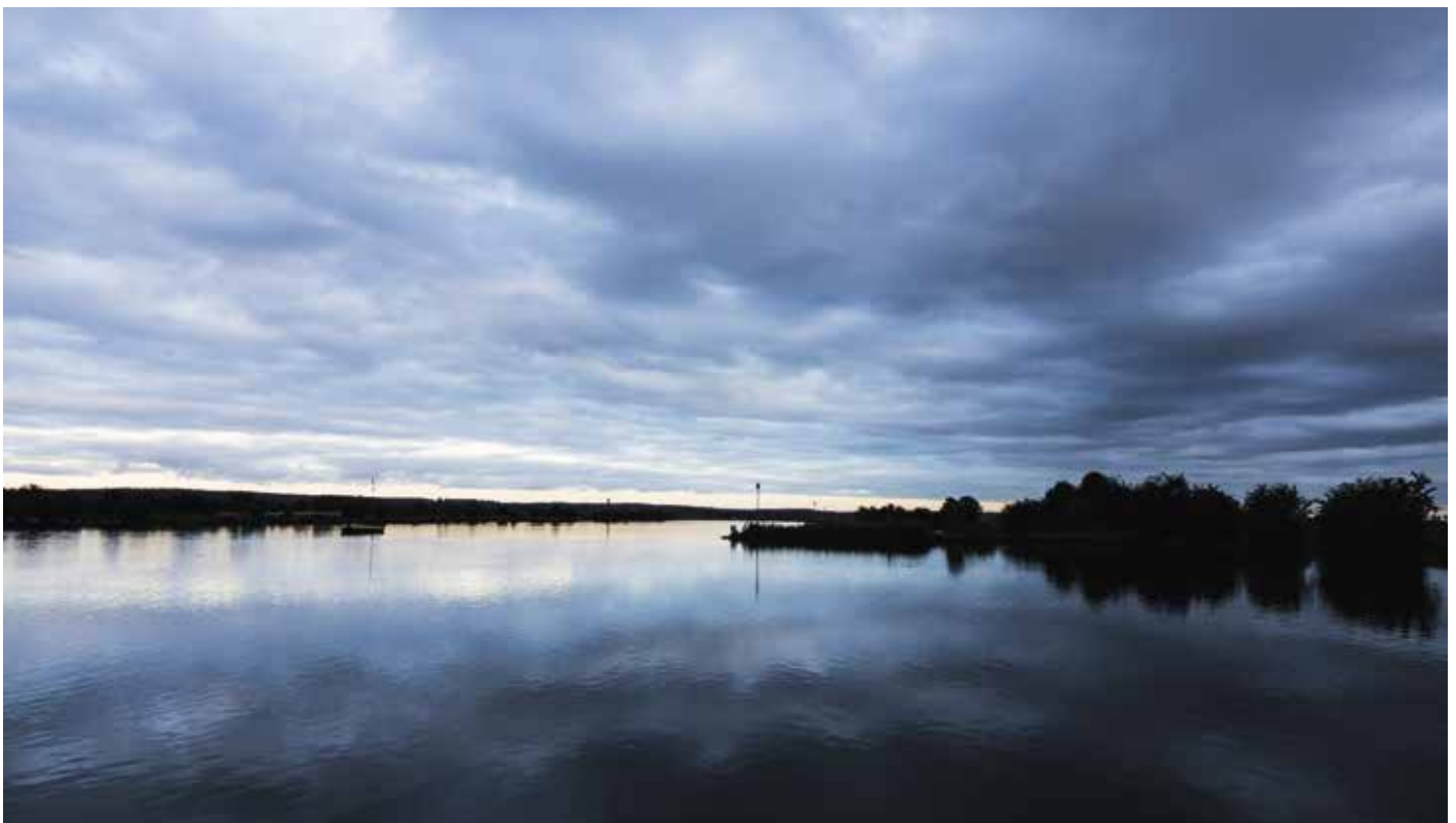
Een interessante stek langs de rivier om snel even af te vissen.

Om de combinatie van fishfinder en accu licht te houden, maak ik gebruik van een Rebelcell 12V18 accu. Deze accu weegt slechts één kilogram en